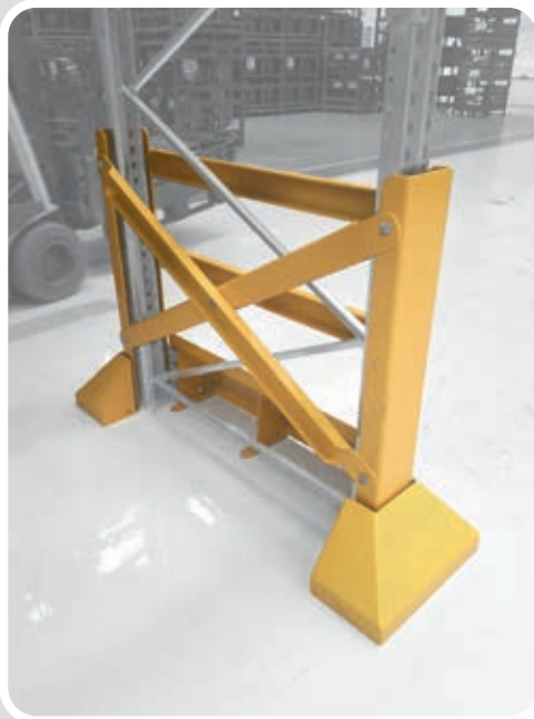
PROTECTORES PARA ESTANTERÍAS